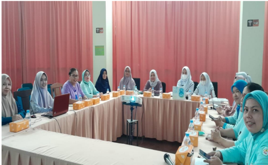
Gambar 2. Pelaksanaan Seminar