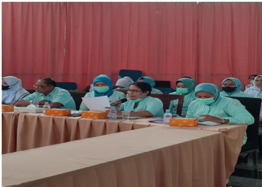
Gambar 3. Pelaksanaan Diskusi