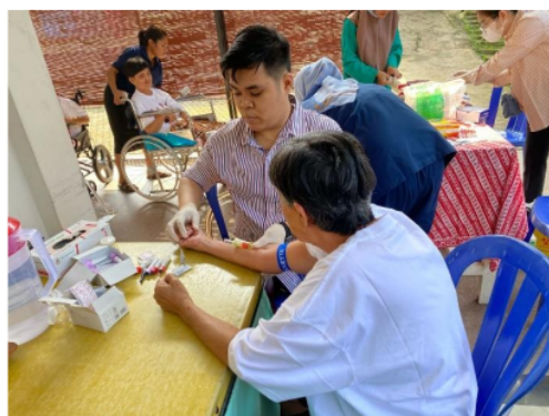
Gambar 3. Kegiatan PKM meliputi anamnesis, pemeriksaan fisik, dan penunjang

14 Resistensi insulin merupakan kondisi kompleks di mana tubuh tidak merespons insulin sebagaimana mestinya. 15 Insulin adalah hormon yang diproduksi oleh pankreas dan berperan penting dalam mengatur kadar gula darah. Obesitas dan resistensi insulin memiliki hubungan yang erat, dan memahami proses obesitas menyebabkan resistensi insulin adalah kunci untuk pencegahan dan pengelolaan kondisi ini. Salah satu faktor utama yang menyebabkan resistensi insulin pada individu dengan obesitas adalah penumpukan lemak visceral. Lemak ini terletak di sekitar organ dalam tubuh dan menghasilkan berbagai sitokin inflamasi serta hormon yang dapat mengganggu fungsi insulin. Selain itu, peradangan kronis yang terjadi pada individu dengan obesitas juga memainkan peran besar. Sel-sel lemak pada kondisi obesitas memproduksi sitokin pro-inflamasi seperti TNF-alpha dan IL-6. Sitokin ini mengganggu sinyal insulin dan berkontribusi terhadap resistensi insulin. (Fantuzzi, 2005; Henning, 2021; Sesti, 2006)