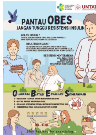
1 Gambar 2. Poster edukasi parameter kepada lanjut usia