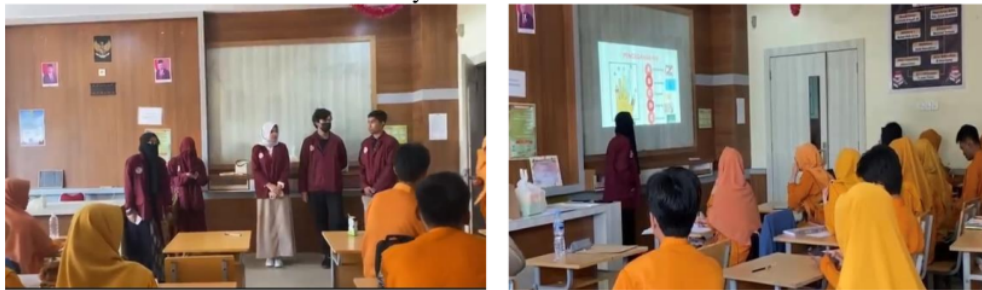
Gambar 3. Penyuluhan dan diskusi

Setelah dilakukan penyuluhan, kembali dilakukan uji pemahaman pengetahuan mahasiswa berupa post test. Didapatkan hasil nilai rata-rata mahasiswa adalah 73,5 dengan nilai minimum 30 dan maksimum 100. Dapat disimpulkan terdapat peningkatan pengetahuan sebelum dilakukan penelitian dibandingkan dengan setelah penyuluhan. Terakhir, peserta penyuluhan dibekali dengan poster yang berisi informasi seputar bahaya merokok dan zat-zat toksik yang terkandung di dalam rokok serta tips dan trik cara berhenti merokok.