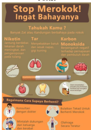
Gambar 4. Poster