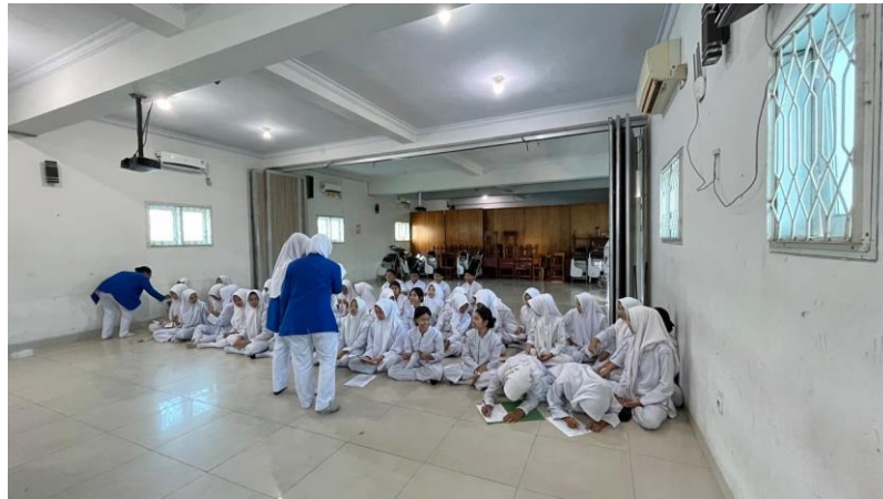
Gambar 2. Pembagian Kuesioner.

Relevansi kegiatan ini terhadap pelayanan kebidanan komplementer juga sangat kuat. Akupresur sebagai bagian dari terapi komplementer yang aman dan noninvasif dapat menjadi alternatif yang bermanfaat bersama dengan intervensi konvensional. Hal ini juga mendukung model pelayanan kebidanan yang berbasis bukti (Ita Novianti, 2026). Dengan demikian, kegiatan penyuluhan yang dilakukan dalam pengabdian Masyarakat ini tidak hanya meningkatkan pengetahuan siswa tentang edukasi akupresur tetapi juga berkontribusi dalam mendukung model pelayanan kebidanan berbasis terapi nonfarmakologi.