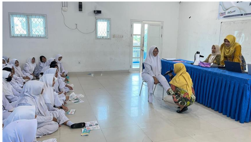
Gambar 4. Praktik Pengenalan titik Akupresur.

Secara keseluruhan, hasil pengabdian Masyarakat menunjukkan bahwa penggunaan media edukasi berupa leaflet, power point dan praktik sederhana dapat efektif dalam meningkatkan pemahaman siswa/i apabila disertai dengan penjelasan yang mudah ditangkap oleh siswa/i.