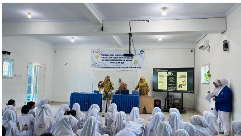
Gambar 3. Pemaparan Materi.