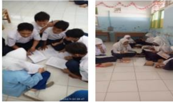
Gambar 2. Dokumentasi kegiatan.

Health Organization, 2018). Dengan demikian, kegiatan penyuluhan yang dilakukan dalam pengabdian masyarakat ini tidak hanya meningkatkan pengetahuan siswa mengenai edukasi seksual, tetapi juga berkontribusi dalam membangun kesadaran remaja untuk menjaga kesehatan reproduksi serta menghindari perilaku seksual berisiko.