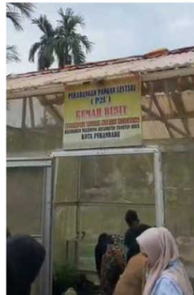
Gambar 2. Proses penanaman TOGA