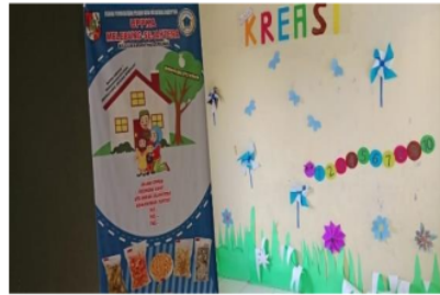
Gambar 6. Pembuatan ruang baca, ruang diskusi, ruang digital dan ruang kreasi