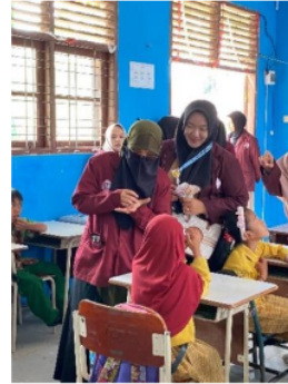
Gambar 1. Sosialisasi dan Edukasi PHBS di SDN 135 Pekanbaru