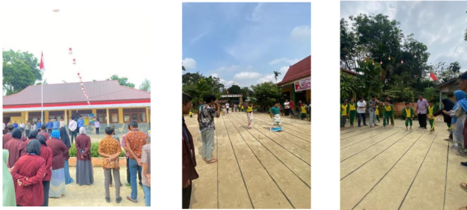
Gambar 7. Kegiatan 17 Agustus SDN 135 Pekanbaru