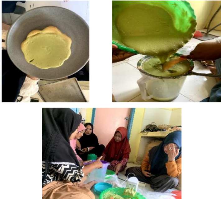
Gambar 10. Pembuatan Bolu Kemojo Protein Tinggi

Bolu Kemojo merupakan salah satu makanan khas Provinsi Riau dengan ciri-ciri berbentuk bunga kemboja berwarna hijau dan beraroma pandan, dalam hal ini Mahasiswa berkolaborasi dalam pembuatan bolu tersebut bersama Mahasiswa PPK Ormawa dan juga beberapa warga dari kelurahan Melebung.