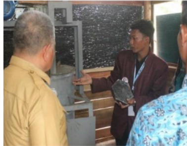
Gambar 11. Eco Paving Block