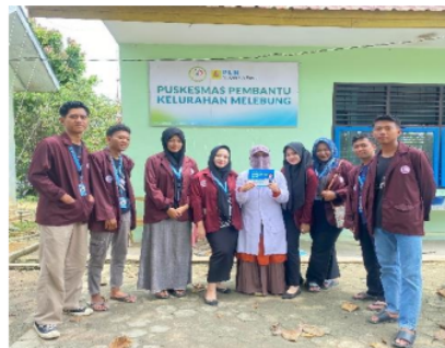
Gambar 5. Kader Kesehatan