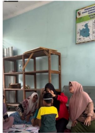
Gambar 3. Penyuluhan Pencegahan Stunting