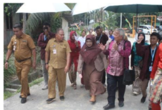
Gambar 8 : Kegiatan Ceremonial 27 Agustus 2024 Kelurahan Meebung