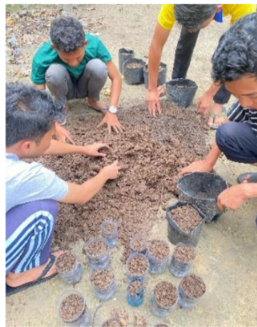
Gambar 4. Pembuatan Hidroponik.