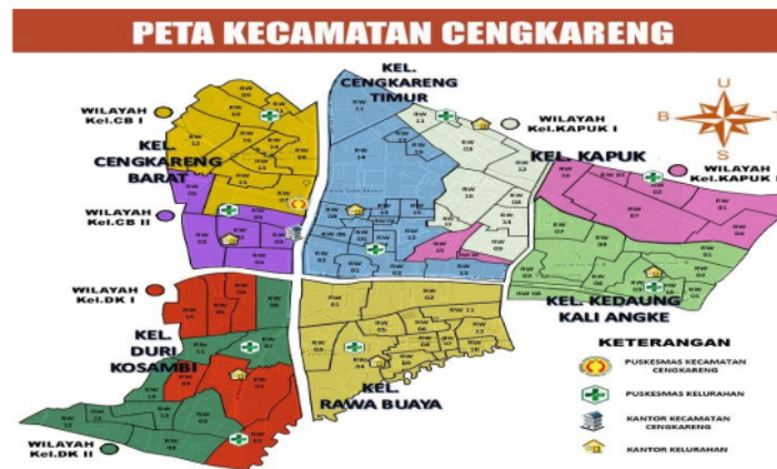
Gambar 2. Peta Wilayah Kecamatan Cengkareng